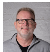
Kalmar Ildstad Direktør Lisensforvaltning (LFV)